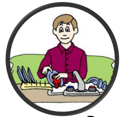
বয়স অনুযায়ী কাজ