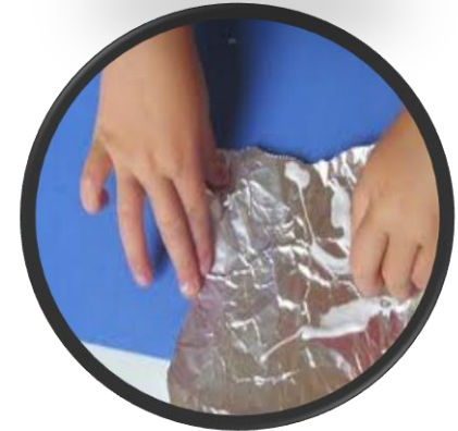
দুই হাত ব্যবহার