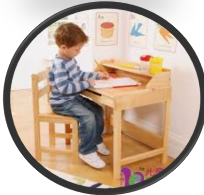
পছন্দ মত কাজ