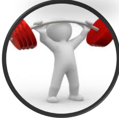
কাজ সম্পর্কে ধারণা