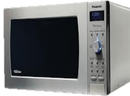
মাইক্রো ওয়েভ ওভেন