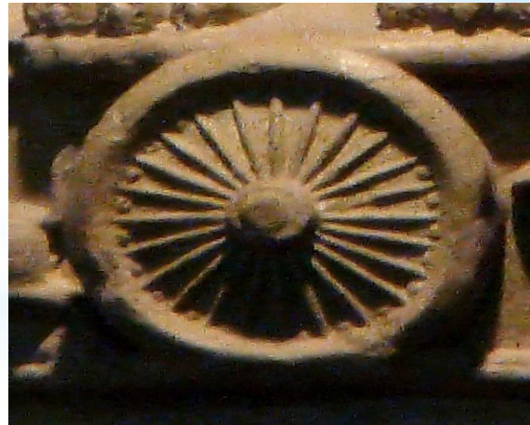
মৌর্য সাম্রাজ্যের কিছু নিদর্শন