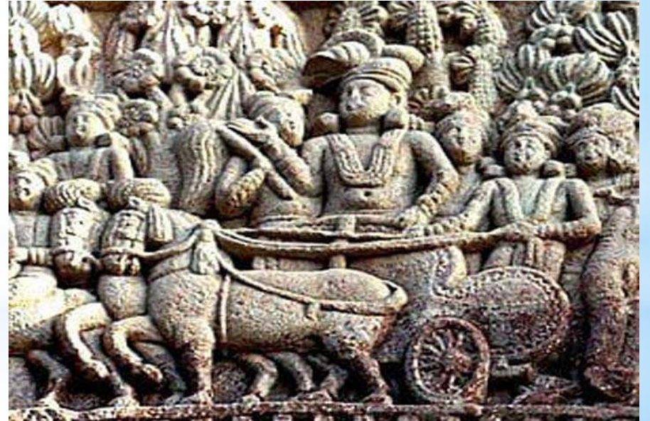
মৌর্য সাম্রাজ্যের কিছু নিদর্শন